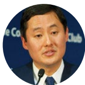
John Yoo, Ph.D.

Emanuel Heller Professor of Law de la Universidad de California, Berkeley. Investigador principal del Instituto Civitas de la Universidad de Texas en Austin e investigador principal no residente del American Enterprise Institute. Ex asistente legal del juez de la Corte Suprema Clarence Thomas. Profesor visitante de la Universidad Nacional de Seúl, Universidad de Keio, Universidad de Trento, Universidad de Chicago y Universidad Libre de Ámsterdam. Director del Public Law and Policy Program de la Facultad de Derecho de la Universidad de California Berkeley. Graduado en la Facultad de Derecho de Yale y summa cum laude en la Universidad de Harvard.