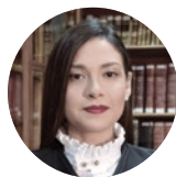
Mercedes Caicedo, Mgs. Conjueza de la Corte Nacional de Justicia